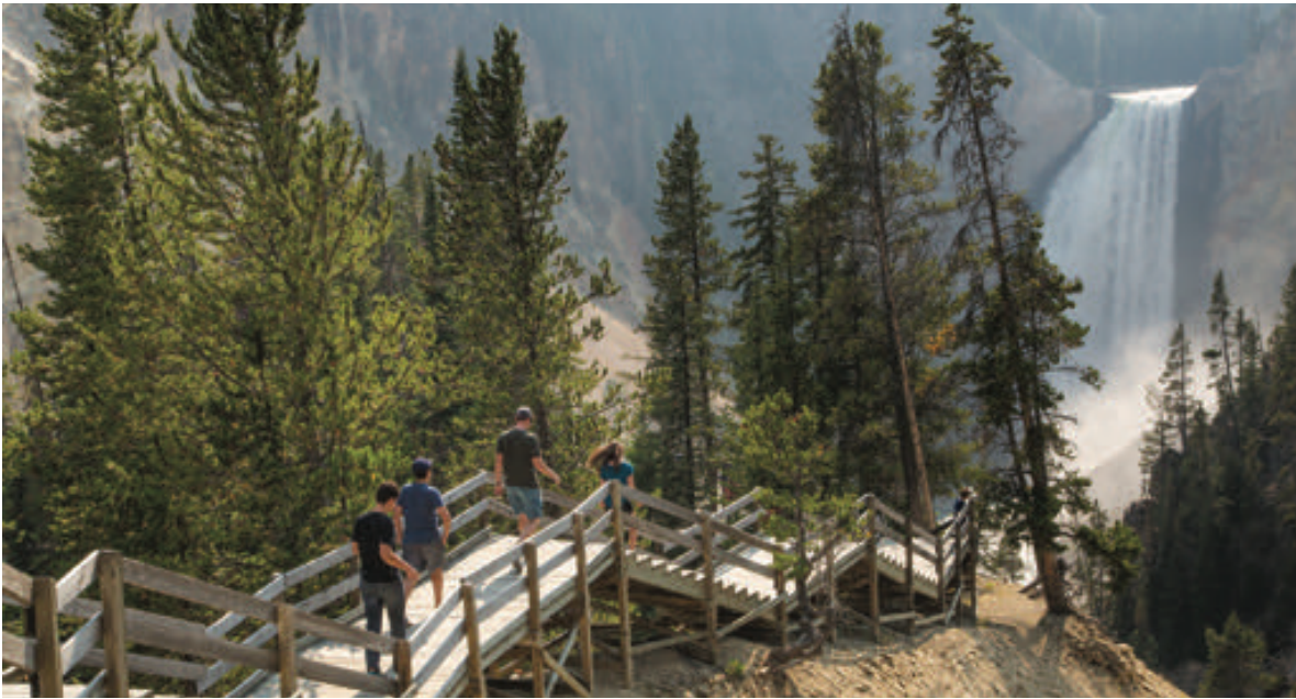
到达灵感点 (Inspiration Point) 前的最后几级台阶

该景点预计在 2018 年竣工后重新开放，您可以从这里看到峡谷的壮观景色，包括上游和下游。您还可以看到鸟儿上下翻飞，一展其杂技才能，并闻到从峡谷深处地热温泉中散发出的硫磺味。