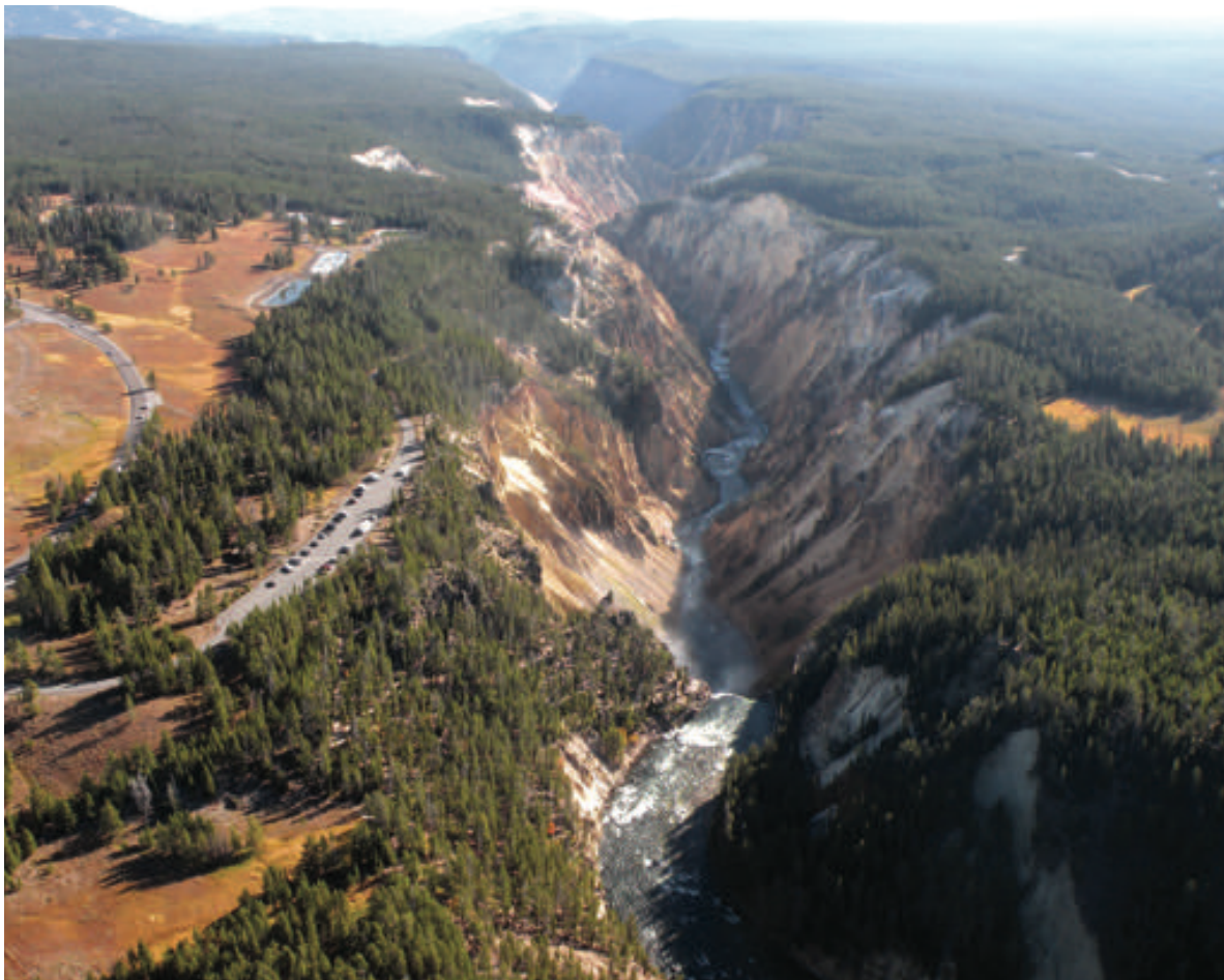
从下瀑布悬崖 (Brink of Lower Falls) 俯瞰东北方向

峡谷中色彩绚丽的岩石源于地热温泉侵蚀的流纹岩和沉积物。如果您仔细观察河边的深橙色、棕色和绿色区域，就可以看到仍然活跃的地热温泉。它们的活动以及水、风和地震作用继续雕琢着峡谷。