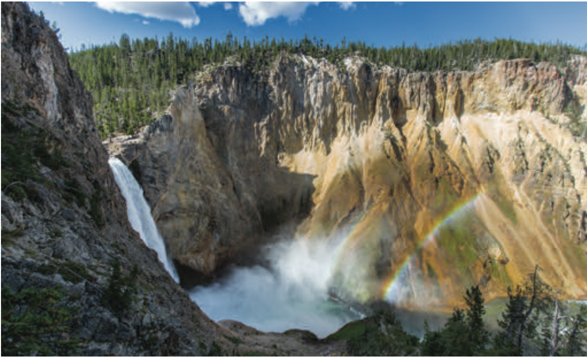
从汤姆叔叔步行道 (Uncle Tom's Trail) 观赏下瀑布 (Lower Falls)

可以看到下瀑布 (Lower Falls)，听到瀑布的轰鸣声，并感受到瀑布的雷霆之力。许多台阶是用穿孔钢板建成，因此您应该穿舒适的平底步行鞋。清晨时或春秋两季还要注意路面是否结冰。这条步行道在冬季关闭，春秋季节路况不好时也会关闭。