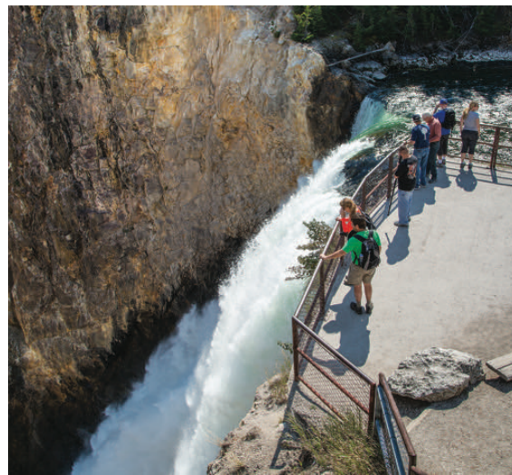
上瀑布悬崖 (Brink of the Upper Falls) 观景台