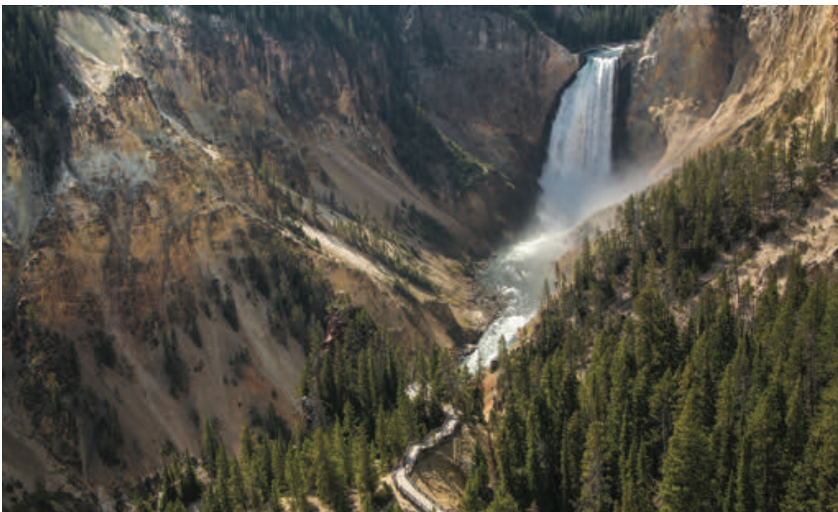
从眺望点 (Lookout Point) 看通往红岩点 (Red Rock Point) 的步行道