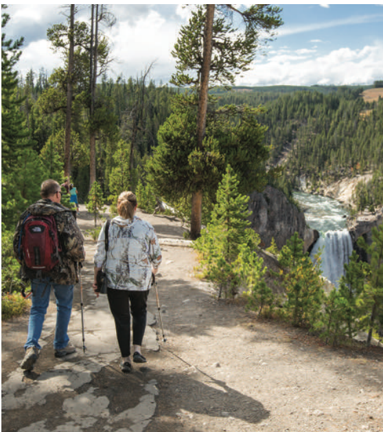
南缘步行道 (South Rim Trail) 是游客喜爱的步行道

可以看到下瀑布 (Lower Falls)，听到瀑布的轰鸣声，并感受到瀑布的雷霆之力。许多台阶是用穿孔钢板建成，因此您应该穿舒适的平底步行鞋。清晨时或春秋两季还要注意路面是否结冰。这条步行道在冬季关闭，春秋季节路况不好时也会关闭。